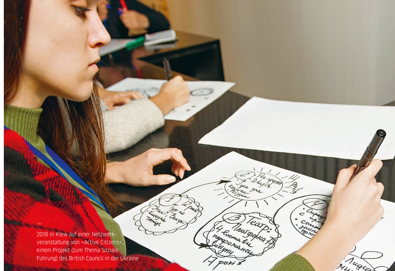
2018 in Kiew auf einer Netzwerkveranstaltung von »Active Citizens« einem Projekt (zum Thema Soziale Führung) des British Council in der Ukraine