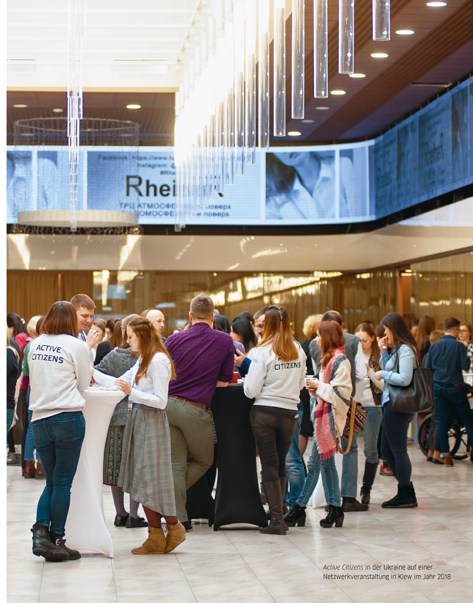
Active Citizens in der Ukraine auf einer Netzwerkveranstaltung in Kiew im Jahr 2018

In der Praxis schließen sich diese Modelle von Projekten in Kulturbeziehungen nicht gegenseitig aus, sondern lassen verschiedene Macht- und Einflussverhältnisse entstehen. Sowohl die Kulturakademieprogramme als auch »Active Citizens« zum Beispiel agieren in einer Mischung aus Netzwerk- und Kaskadenmodell, da sie nicht nur zu Beginn Weiterbildungsformate für Schlüsselpersonen bereitstellen, sondern diese Personen ihre neuen Kenntnisse anschließend an andere Personen weitergeben.