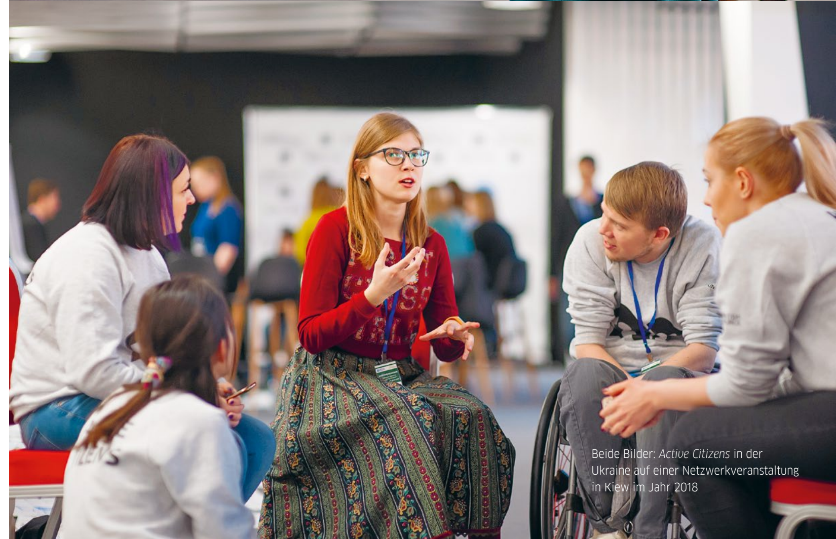
Beide Bilder: Active Citizens in der Ukraine auf einer Netzwerkveranstaltung in Kiew im Jahr 2018