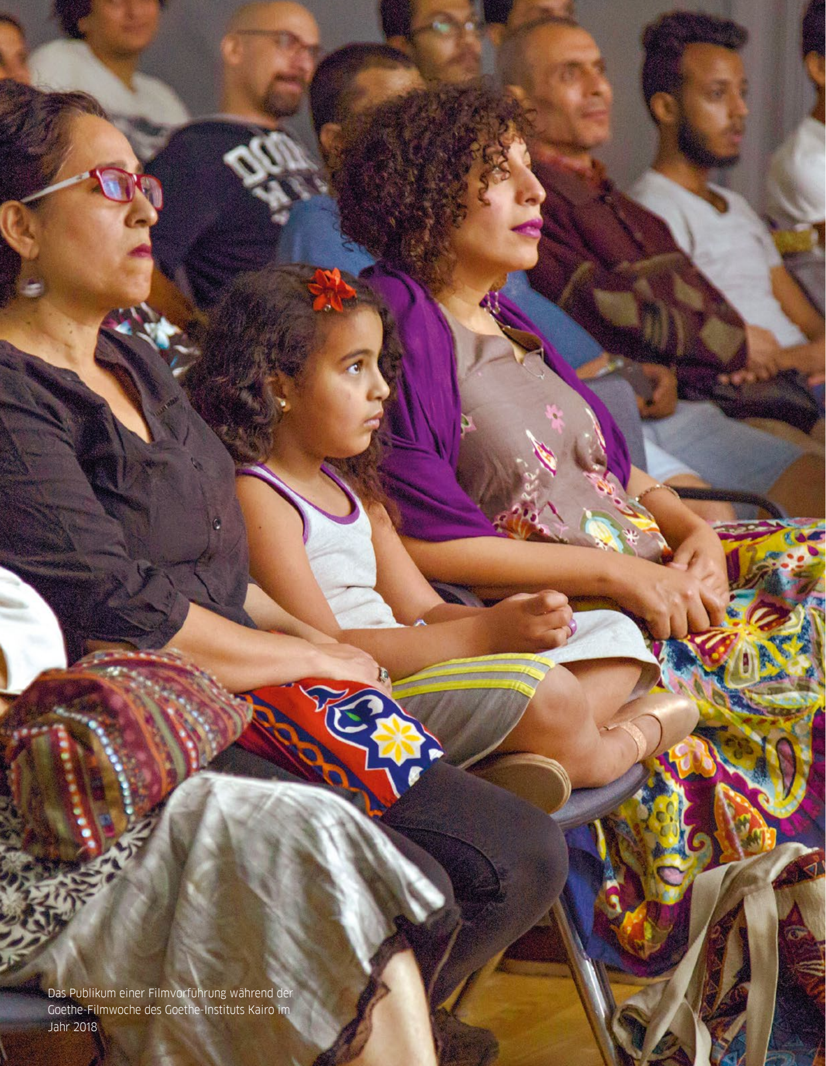
Das Publikum einer Filmvorführung während der Goethe-Filmwoche des Goethe-Instituts Kairo im Jahr 2018