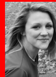
Cross Innovation Business Development Manager / Broker