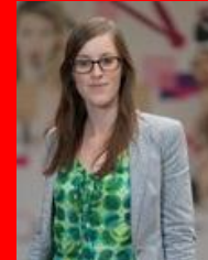
International Project Manager, Design Flanders