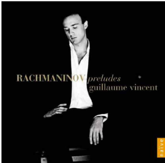
Rachmaninov / Guillaume Vincent - Préludes (2xCD, Album)