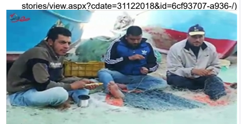
الفيديو الصيدي في الإسكندرية مهنة بالوراثة وصناعة الشباك عشق الطفولة (9917-a7a9-e9d8e8a49120)