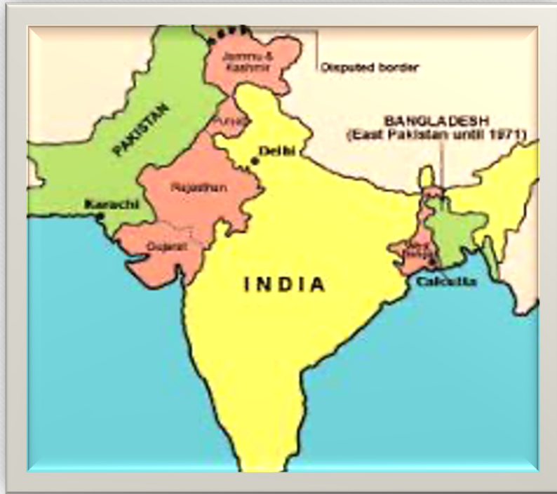
Teilung Indiens: 1947