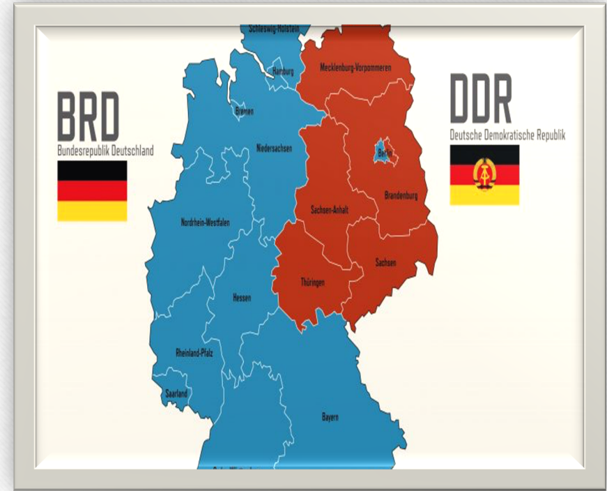
Teilung Deutschlands: 1949