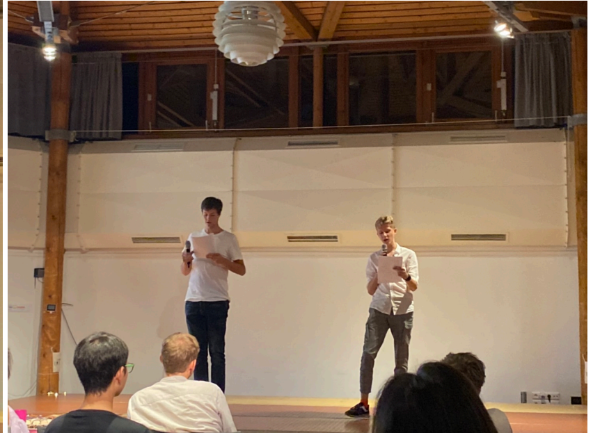
Titel der Präsentation (anpassen über Ansicht/Kopf- und Fußzeilen)