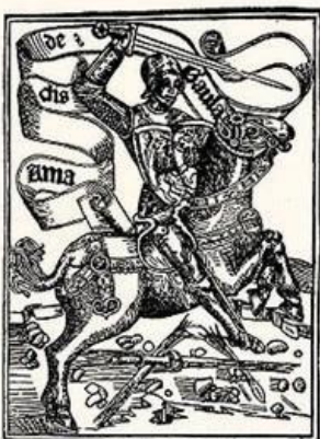
Los cuatro libros del virtuoso caballero Amadís de Gaula; Comptos.

Compara la vida de ese tiempo con la vida moderna, y comparte tus ideas con los demás.