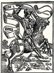
Los cuatro libros del tirano caballero Amadis de Gaula: Comptos.

Amadis de Gaula es una historia romántica famosa sobre héroes. Era muy conocida en la vida del castillo. Era el libro favorito de Don Quijote. Se cree que fue escrito por Enrique de Castilla, quien murió en 1305.