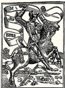
Los cuatro libros del tirano caballero Amadís de Gaula: Complots.

Amadís de Gaula es una historia romántica famosa sobre héroes. Era muy conocida en la vida del castillo. Era el libro favorito de Don Quijote. Se cree que fue escrito por Enrique de Castilla, quien murió en 1305.