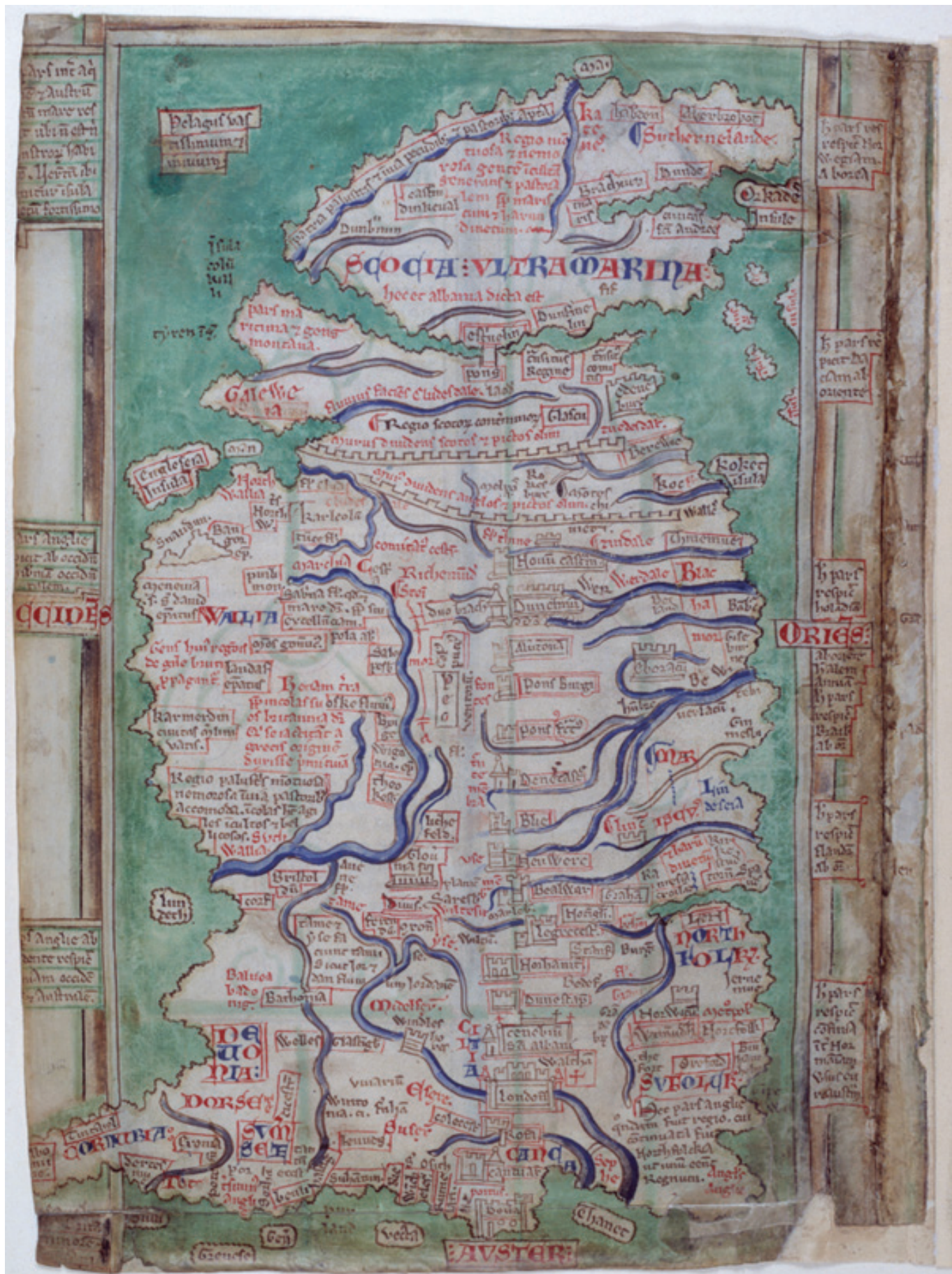
(Cotton MS Claudius D VI, British Library, de dominio público)

El mapa Matthew Paris recoge 252 lugares, incluidas 81 catedrales y monasterios, 41 castillos y 33 puertos.