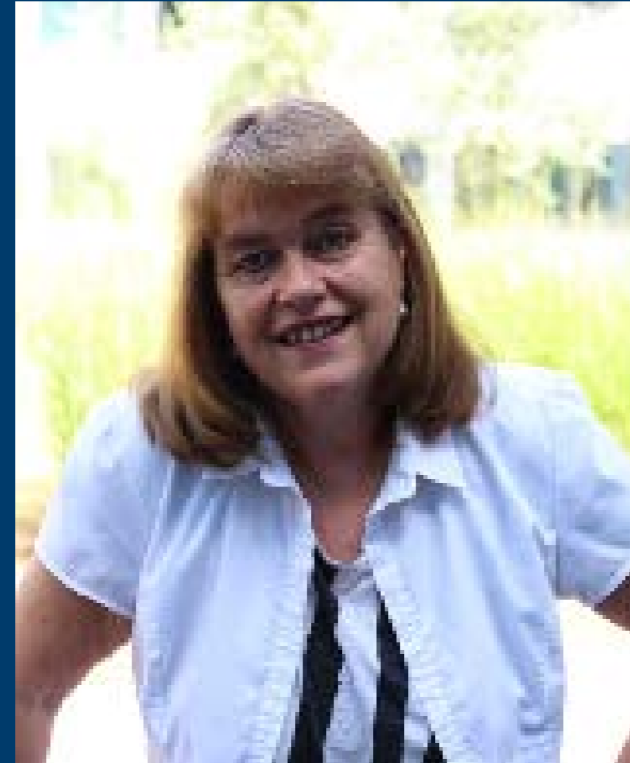
Prof. Dr. Marion Grein Hueber Verlag