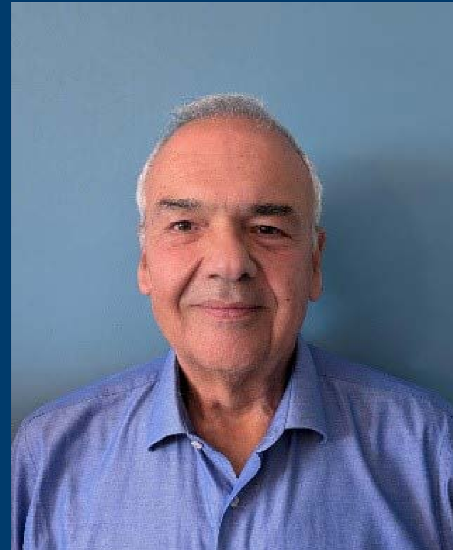
Spiros Koukidis Praxis Verlag