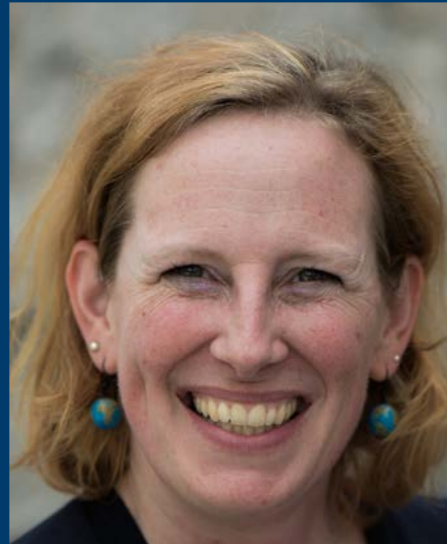
Birgitta Fröhlich Klett Sprachen