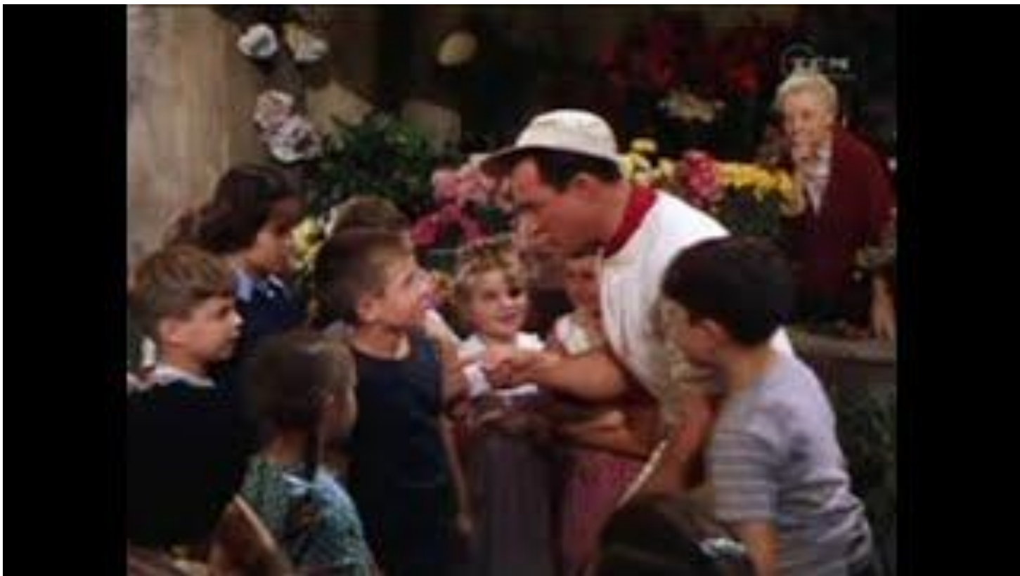
An American in Paris Musical Gene Kelly George Gershwin I Got Rhythm rythme