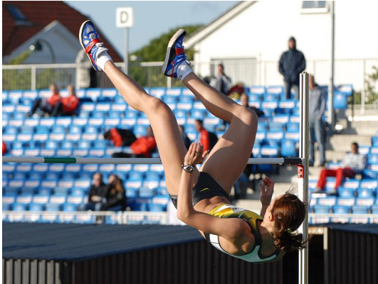
Yelena Slesarenko 2004 Athens, Greece Gold 2.04 m

units of measurement unités de mesure Maßeinheiten