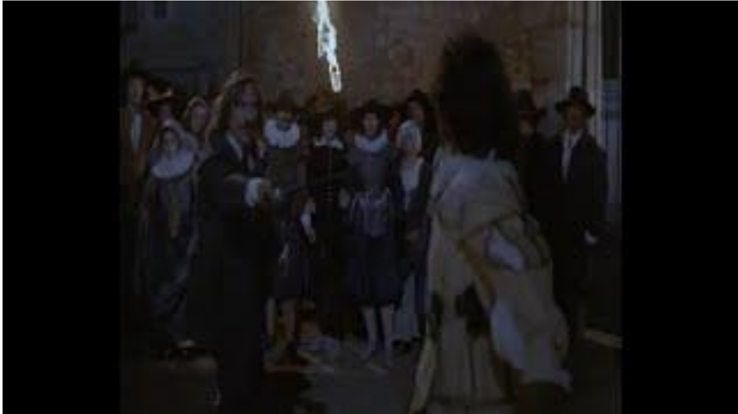
Cyrano de Bergerac film 1990 Gérard Depardieu Rostand composer une ballade en ferrailant