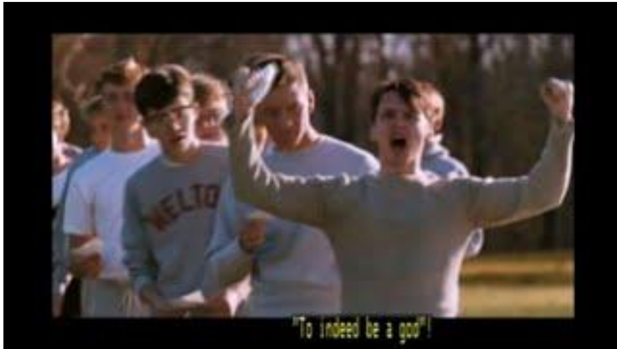
Dead Poets Society Learning while kicking a ball