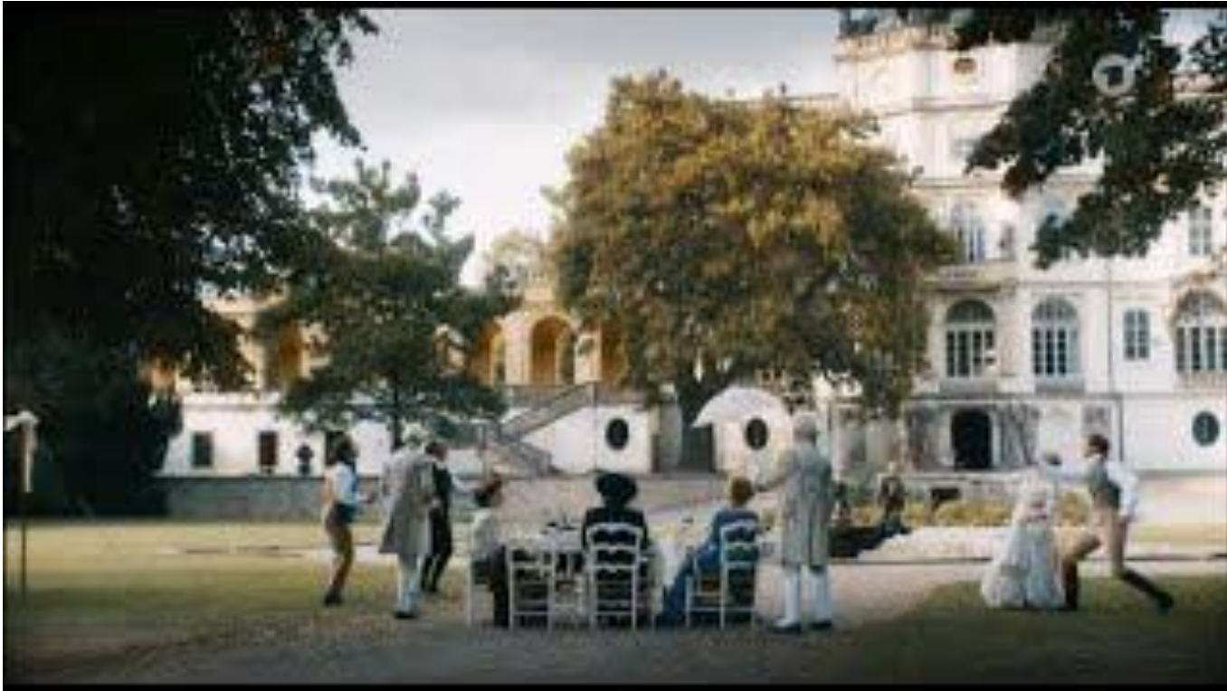
Louis van Beethoven Film 2020 Federballspiel Schiller Ode an die Freude