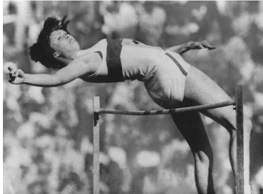
Ulrike Meyfarth 1984 Los Angeles, USA Gold 2.02 m