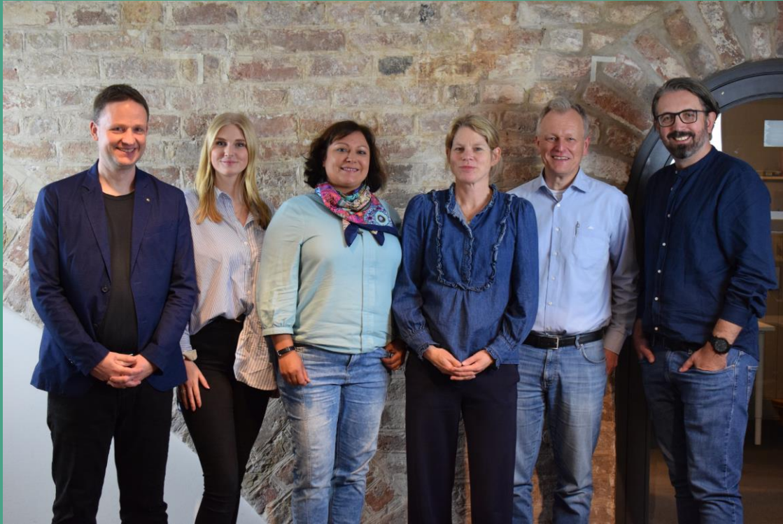
Tagungsleitung im Herbst 2022