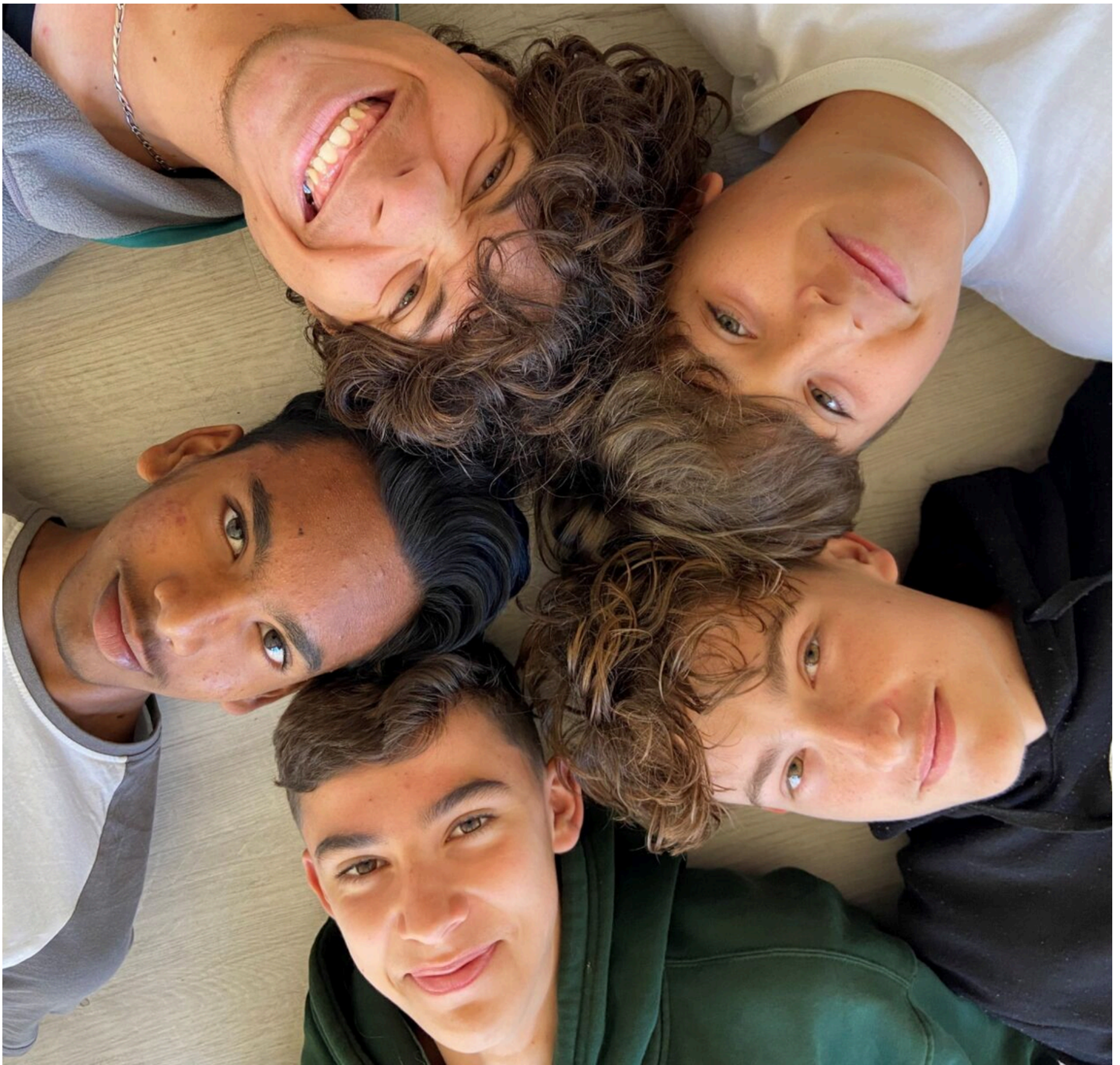
AGRUPAMENTO DE ESCOLAS DE ALBUFEIRA ALBUFEIRA, PORTUGAL