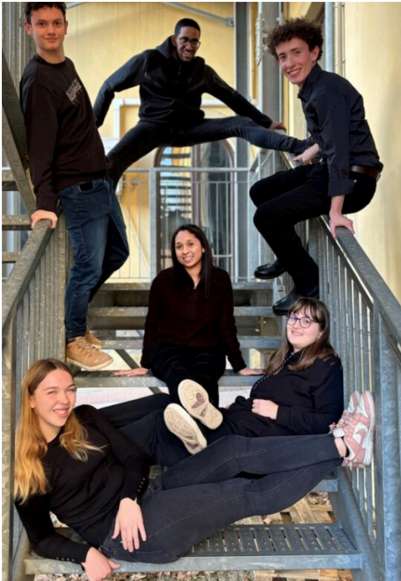
LICEO G. PASCOLI FLORENZ, ITALIEN